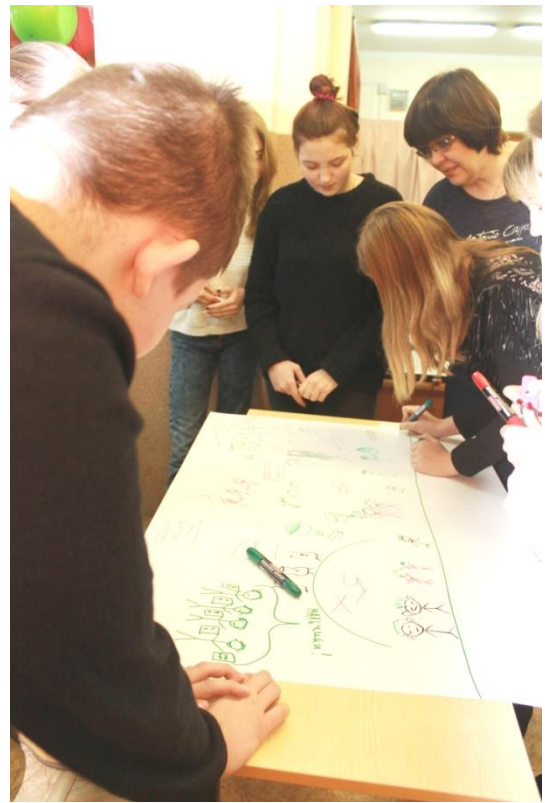
Участники выполняют задание, после комментируют полученные результаты